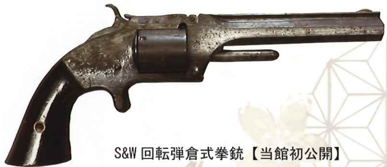
S&W 回転弾倉式拳銃【当館初公開】