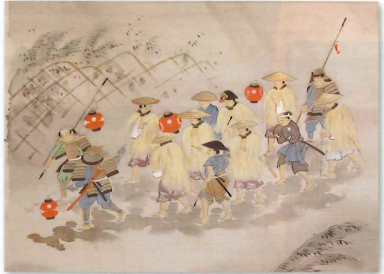
七卿西竄図（部分）（竹本義明氏寄贈）